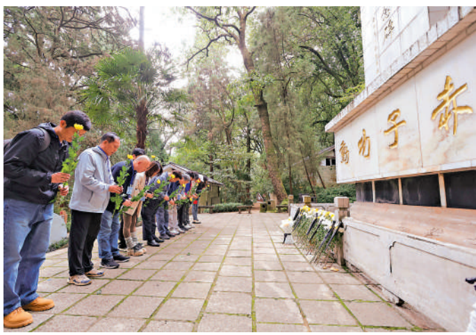
▲媒體團成員在南僑機工紀念碑前獻花。