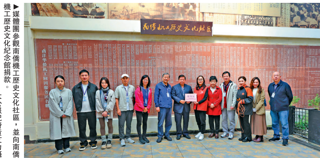
▲媒體團參觀南僑機工歷史文化社區，並向南僑機工歷史文化紀念館捐款。

目前，晉祠公園已做好各項服務保障工作，力求為遊客提供一個安全、舒心的環境，方便大家沉浸式體驗古建園林與金秋盛景交融的獨特魅力。