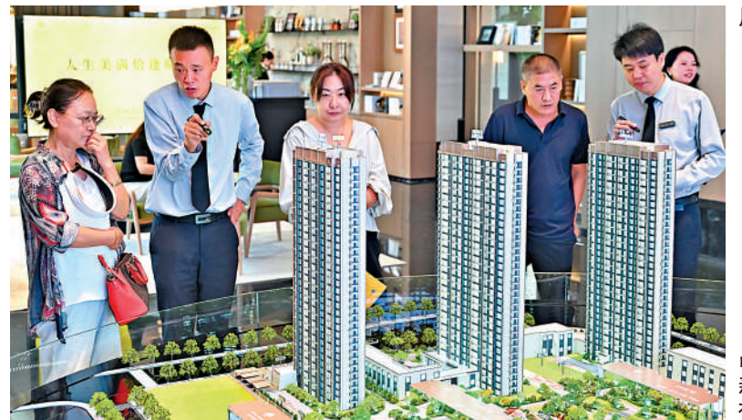
▲山西太原市民在一家房地產銷售樓部看房。

《建議》提出，推動房地產高質量發展。加快構建房地產發展新模式，完善商品房開發、融資、銷售等基礎制度。優化保障性住房供給，滿足城鎮工薪群體和各類困難家庭基本住房需求。因城施策增加改善性住房供給。建設安全舒適綠色智慧的「好房子」，實施房屋品質提升工程和物業服務質量提升行動。建立房屋全生命周期安全管理制。