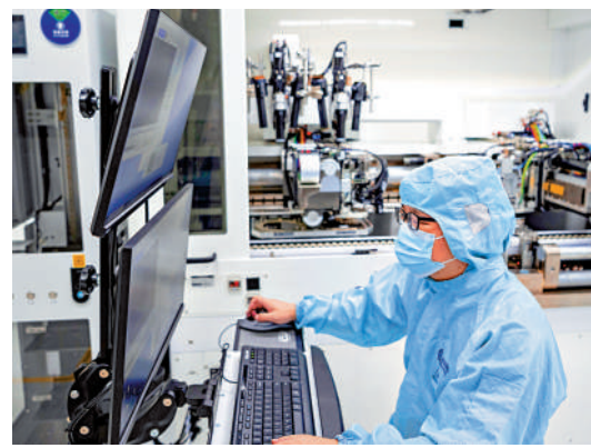
▲工人在宏芯科技（泉州）有限公司硅光芯片生產車間進行作業。

推動科技創新和產業創新深度融合方面，《建議》提出，統籌國家戰略科技力量建設，增強體系化攻關能力。加快重大科技成果高效轉化應用，強化企業科技創新主體地位，推動創新資源向企業集聚，鼓勵企業加大基礎研究投入。培育壯大科技領軍企業，支持高新技術企業和科技型中小企業發展。