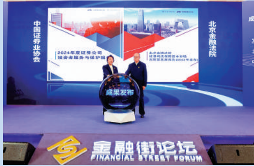
▲2025金融街論壇年會金融法治平行論壇昨日發布《證券司法保障資本市場高質量發展報告》。

報告顯示，從被訴發行人分布看，其間北京金融法院受理證券糾紛案件涉及的67家發行人。從案涉市場板塊分布看，上交所主板20家、深交所主板16家、創業板16家、新三板10家、北交所1家、港交所4家。除科创板之外，北京金融法院審理的證券案件對所有市場板塊全覆蓋。 大公報記者 馬曉芳