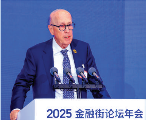
▲羅奇表示，中國在產業深化與創新方面表現亮眼。