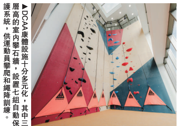
DCAA康體設施十分多元化，其中三層高的室內攀岩牆，設置七組自動保護系統，供運動員攀爬和繩降訓練。