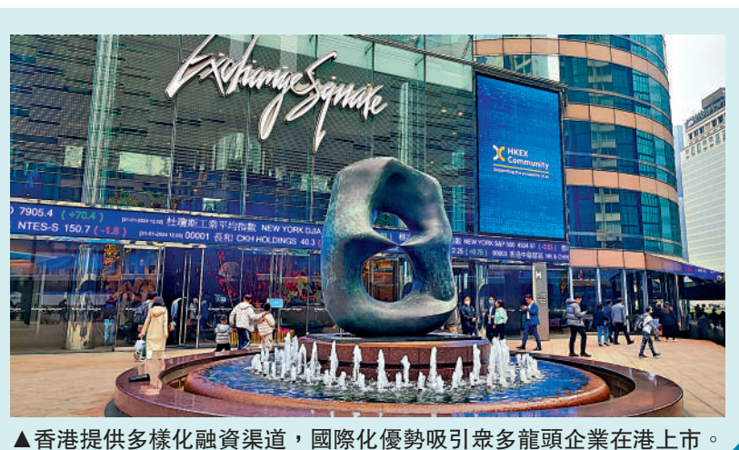
香港提供多樣化融資渠道，國際化優勢吸引眾多龍頭企業在港上市。