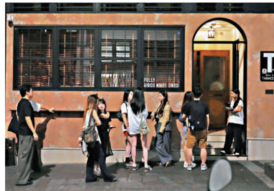
▲中環Bar Leone酒吧首度獲得「世界最佳酒吧」榮銜。

精益求精與創新精神。瑰麗酒店集團旗下共有4間酒店獲選全球50佳酒店，3間酒店獲列入擴展榜單。