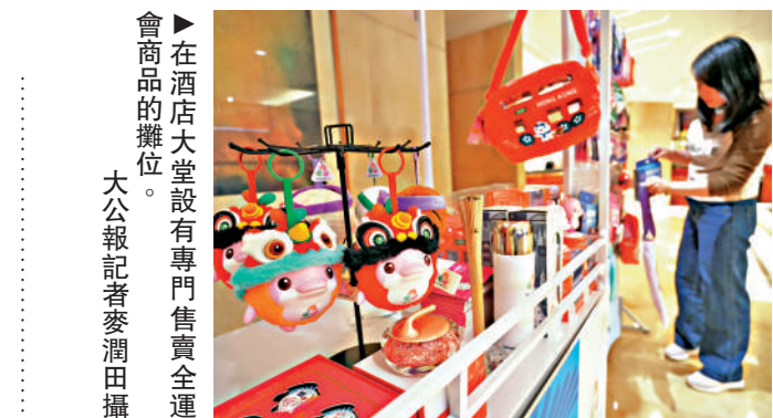
▲在酒店大堂設有專門售賣全運會商品的攤位。