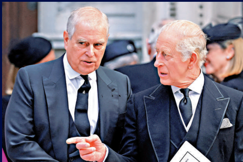
▲英國國王查爾斯三世（右）決定剝奪安德魯的王室頭銜。