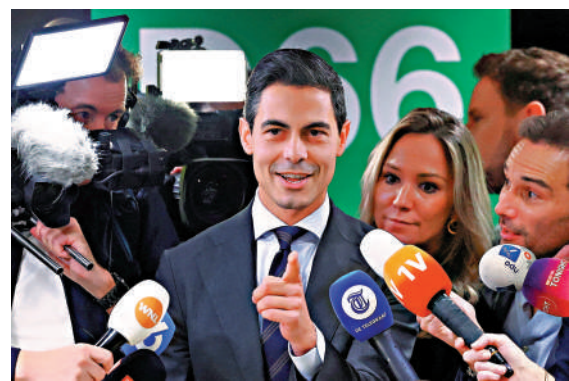
▲六六民主黨領導人耶滕有可能成為荷蘭最年輕首相。

【大公報訊】據法新社報道：荷蘭眾議院選舉計票工作接近尾聲，荷蘭通訊社10月31日宣布，親歐中間派政黨六六民主黨以微弱優勢擊敗極右翼政黨自由黨。該黨領導人耶滕隨即宣布勝選，並表示：「我們向其他歐洲國家乃至世界證明，擊敗民粹主義運動是有可能的。」