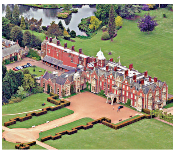
▲安德魯將搬進桑德靈厄姆莊園。網絡圖片

朱弗雷遺作回憶錄10月21日出版，披露她曾被迫參與涉及愛潑斯坦、安德魯及大約8名其他年輕女孩的淫亂行為。