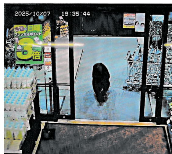
▲10月7日，一頭熊闖入日本群馬縣的一家超市。

據日本環境省統計，始於今年4月的2025財年已有12人遭熊襲擊喪生，較先前死亡人數最多的2023財年增加了近一倍。宮城縣、岩手縣、秋田縣等多地均發生熊襲擊致人死亡事件。日本內閣官房長官木原稔10月30日表示，「熊害」已對學校教學和旅遊業造成影響，必須採取「全面且靈活的應對措施」。據悉，