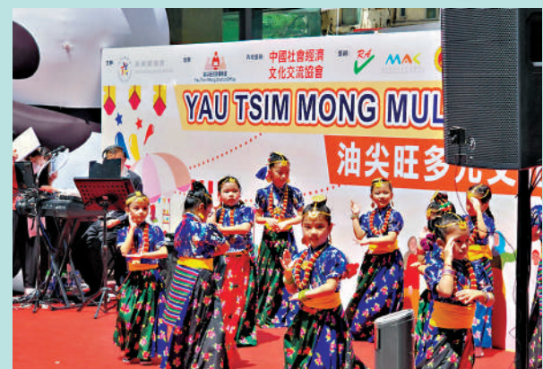
▲香港作為一個多元共融的國際城市，每一個族群皆有展現自我價值的舞台。