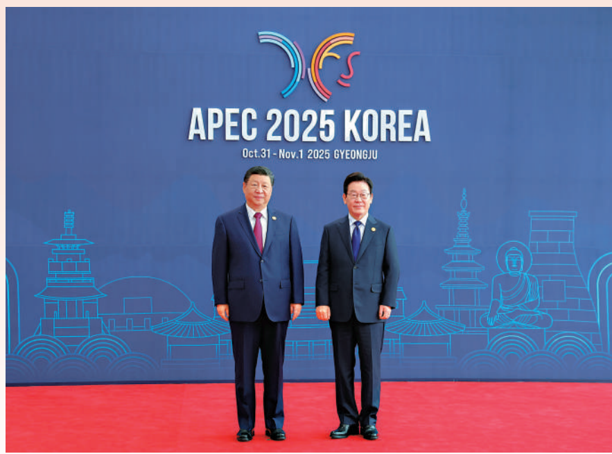
▲當地時間10月31日上午，亞太經合組織第三十二次領導人非正式會議第一階段會議在韓國慶州和白會議中心舉行。國家主席習近平出席會議並發表重要講話。習近平抵達會場時，韓國總統李在明熱情迎接。