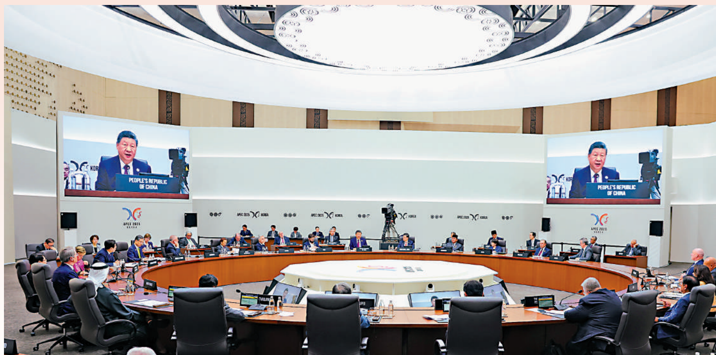
▲國家主席習近平昨日出席APEC領導人非正式會議第一階段會議，發表題為《共建普惠包容的開放型亞太經濟》的重要講話。新華社