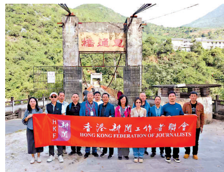
◀ 「重走滇緬公路」媒體團在惠通橋實地採訪。

「重走滇緬公路」主題採訪活動由雲南省人民政府新聞辦公室與香港新聞工作者聯會聯合開展，將持續到11月1日。活動旨在全方位展現滇緬公路的歷史貢獻與其承載的時代價值，以此銘記歷史、緬懷先烈、傳承和弘揚抗戰精神。