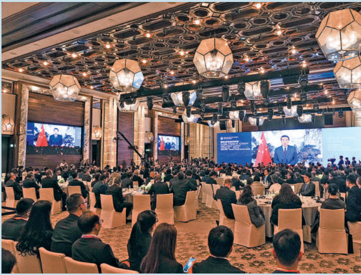
▲國際金融領袖投資峰會的主峰會昨日圓滿舉行，峰會匯聚約300位國際金融領袖。

何立峰指出，香港金融業保持平穩運行，離岸人民幣市場穩步發展，資本市場表現亮眼，恒生指數漲幅和IPO募資額居於全球前列，這些成績證明「一國兩制」具有強大的生命力，香港保持長期繁榮穩定具備堅實的基礎，香港國際金融中心的地位必將進一步鞏固提升。