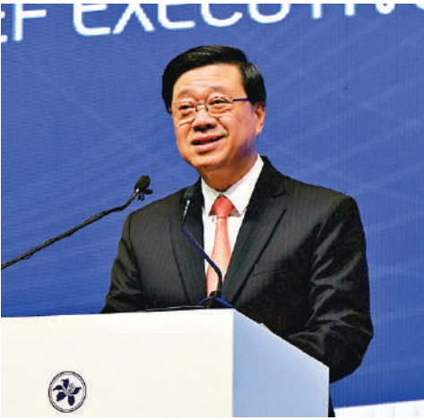
▲李家超在國際金融領袖投資峰會發表主題演講。

他進一步指出，特區政府已發布第二份數字資產發展政策聲明，正與監管機構合作制定面向未來的監管體系。除了牌照發放，香港允許在受控環境下測試有前景的金融科技應用，推動代幣化資產即時交易，探索代幣化資產在貿易和其他領域的潛力。