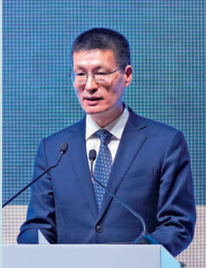
▲陸磊表示，港澳居民代理見證開戶已擴大至8家銀行。

就拓展完善人民幣跨境支付系統（CIPS）在港業務，陸磊表示，截至9月末，CIPS在香港的直接、間接參與機構已達113家，有效便利了國際貿易投融资的跨境結算。人行推動跨境支付通、數字人民幣跨境支付平台，積極推進粵港澳大灣區二維碼跨境掃碼支付，便利兩地人員經貿往來。