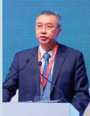
▲周亮指出，支持港資機構到內地發展。

四是加強監管合作，防範金融風險。進一步完善內地與香港金融監管合作機制和政策框架，防範跨境金融風險，促進兩地的金融業高質量發展，積極應對外部風險。