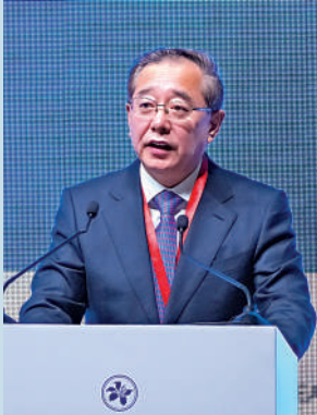
▲李明表示，中證監將深化跨境監管與執法合作。

李明認為，香港國際金融中心的競爭力影響力日益增強，對全球投資者的吸引力不斷提升，形成「香港好、國家好、國家好、香港更好」的生動寫照。隨着中國資本市場對外開放將縱深推進，兩地資本市場通過優勢互補、協同發展，不僅能為香港鞏固提升國際金融中心地位提供堅實基礎，也能為國家經濟和企業高品質發展注入強大動力。