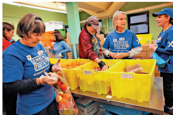
▲紐約生活成本上漲，慈善機構10月30日為陷入困境的市民準備救濟糧。