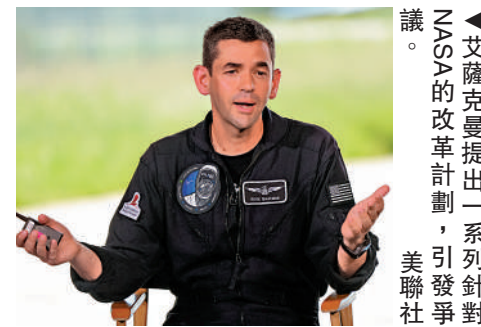
▲艾薩克曼提出一系列針對NASA的改革計劃，引發爭議。

與艾薩克曼曾向民主黨捐款有關。特朗普4日並未提及此前撤回提名一事。另據報道，艾薩克曼在首次提名後撰寫了一份長達62頁的「雅典娜計劃」，內容涉及多項重大改革，但近日遭到洩露。艾薩克曼計劃增加NASA對商業太空產業的依賴，主張購買商業公司的科研數據，而非NASA自行發射衛星。他還提議，NASA應退出「由納稅人資助的氣候科學研究」，引發科學界批評。