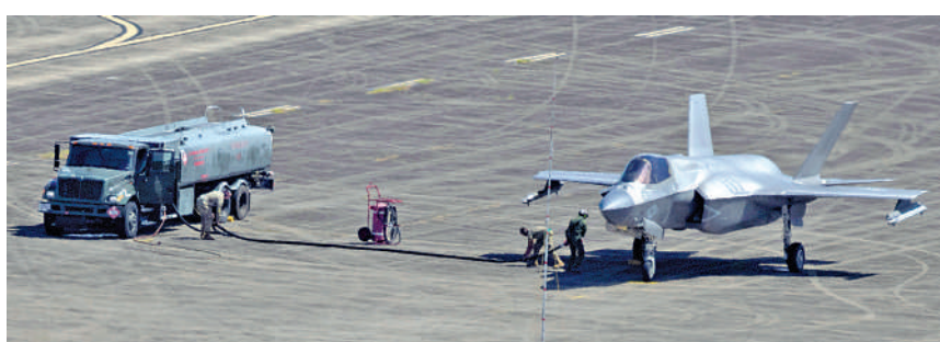
▲沙特長期對美國的F-35戰機感興趣。圖為美軍為一架F-35戰機加油。

【大公報訊】據路透社報道：知情人士4日透露，美國政府正在考慮向沙特阿拉伯提出的購買多達48架F-35戰機的請求。這筆潛在價值數十億美元的交易已在五角大樓的審批程序中取得「關鍵進展」。沙特王儲穆罕默德將於本月18日到訪白宮，並與美國總統特朗普舉行會晤。