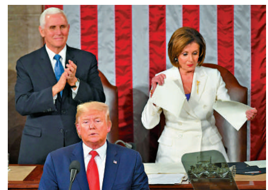
▲佩洛西2020年在特朗普身後撕毀其國情咨文稿。

佩洛西是國會山最富有的議員之一，被評為「國會十大股神議員」之一，其家族的股票交易長期被質疑涉內幕交易。2023年，她的丈夫保羅在美國國會通過芯片法案前大量購入半導體巨頭英偉達的股票，引發巨大爭議。