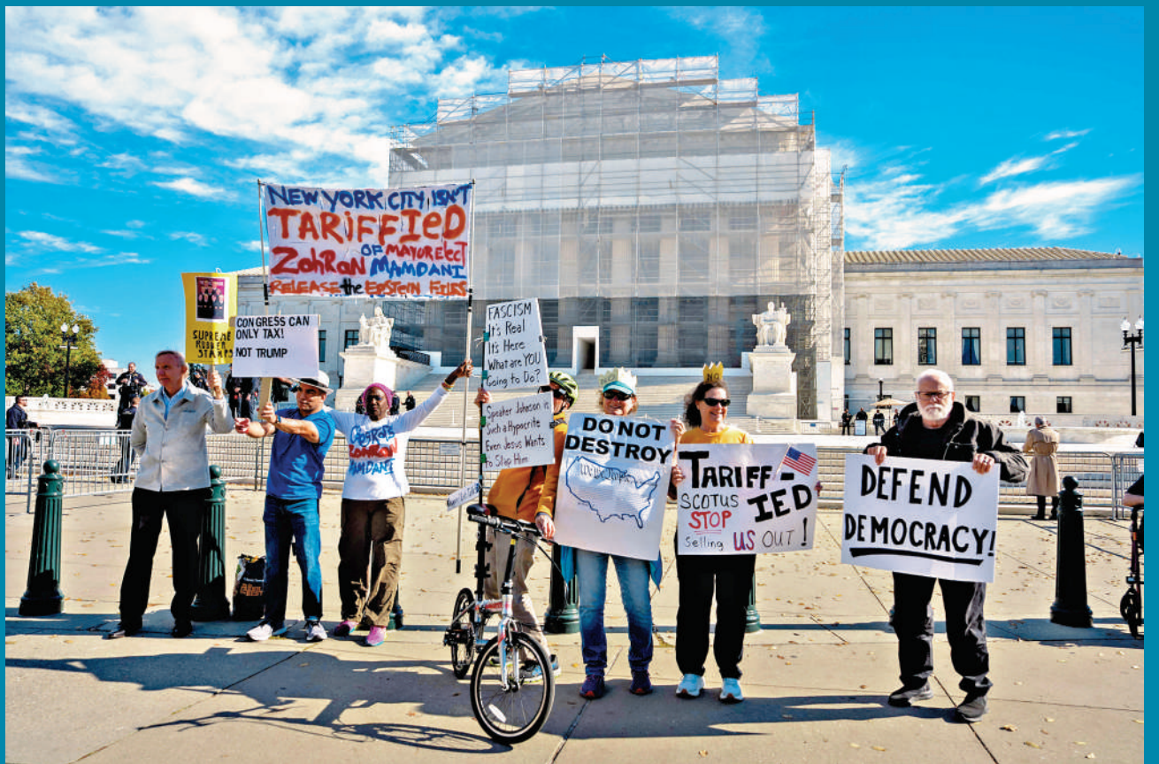
▲美國民眾5日在最高法院門前示威，抗議特朗普的關稅政策。

【大公報訊】今年初重返白宮後，特朗普援引《國際緊急經濟權力法》，宣布美國進入緊急狀態，批准大規模徵收關稅，其中包括4月對所有貿易夥伴徵收的所謂「對等關稅」。4月，美國5家小企業和12個州分別就此對聯邦政府發起訴訟。在美國聯邦巡迴上訴法院和美國國際貿易法院分別裁定現政府一攔子關稅政策違法後，美國最高法院就聯邦政府上訴啟動審理程序。