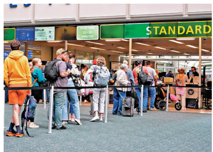
▲美國各地機場面臨空管員不足問題，導致航班延誤和取消。