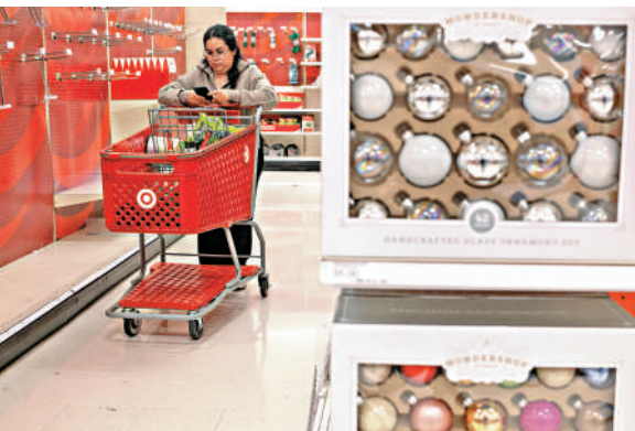
▲今年聖誕季，美國消費者需要為節日裝飾品支付更高價格。

偏保守陣營的首席大法官羅伯茨深入探討了「重大問題原則」。最高法院曾援引該原則宣布拜登政府的學生貸款減免計劃等措無效，理由是這些措施超出國會授予總統的監管權力。法院認為，行政部門不能依賴模