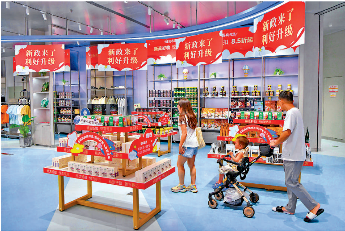
▲離島免稅政策放寬，使海南成為國內外遊客的熱門消費目的地，助力其邁向國際旅遊消費中心。

海南自貿港年底封關臨近。作為粵港澳大灣區的核心城市，香港在這一過程中承擔着不可替代的角色，與海南自貿港聯動發展、深化合作也將為自身發展注入新動能。