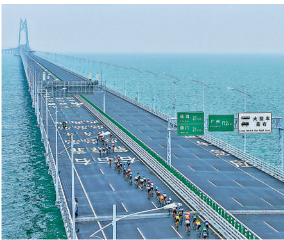
▲賽事將會途經港珠澳大橋。

公眾觀賽區可以容納數百人，市民可乘搭港鐵至迪士尼站，再步行前往指定區域。警方將視乎現場情況實施人流管制，以確保安全與秩序。同時，運輸署提醒市民，賽事期間將實施臨時交通安排，港珠澳大橋香港口岸的離境通關服務將於上午6時30分起暫停6小時，大橋西行方向（香港往珠海或澳門）則從上午7時30分至中午12時30分實施臨時管控。