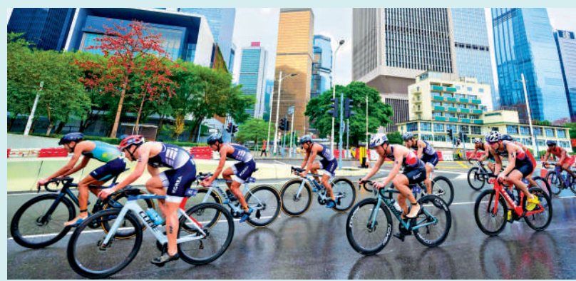
▲三鐵亞錦賽於灣仔海濱長廊對海面起步。