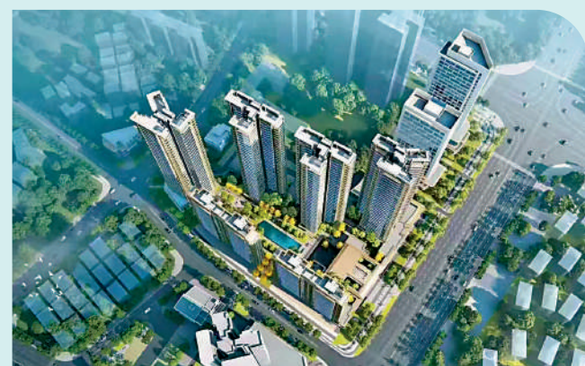
▲智都綠城·鳳凰于飛位於花都區府CBD板塊和中軸CBD板塊交匯處，預計明年底交付。