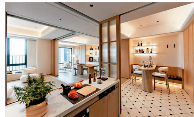
▲美林湖·馬約爾花園單位面積71至118平米，間隔由三房至四房。

118平米四房兩廳戶型，南北雙露台設計，四開間朝南布局，空氣對流，採光性極佳，戶型方正實用，動靜合理分區，主人套房設衣帽間，增加衣物收納量。