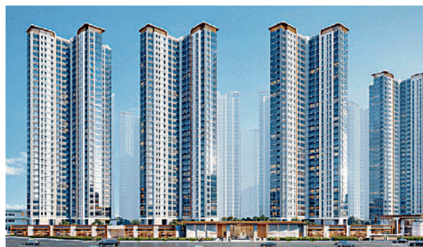
▲智都越秀·臻智府共12幢高層住宅，北高南低布局，保證通風和採光。