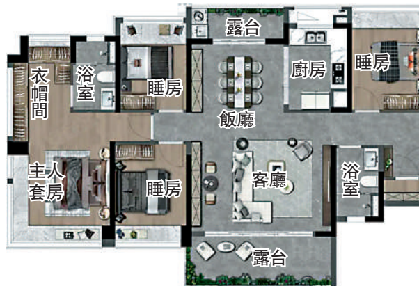
▲智都綠城·鳳凰于飛144平米四房兩廳戶型圖。

智都綠城·鳳凰于飛距離融創文旅城僅約800米，該文旅城涵蓋60萬平方米的世界樂園、亞洲最大的室內滑雪場、11萬平方米商業中心和1.5萬平方米風情酒吧街等。項目約2公里範圍內，駿壹萬邦、來又來、廣百、大潤發等商圈環伺。