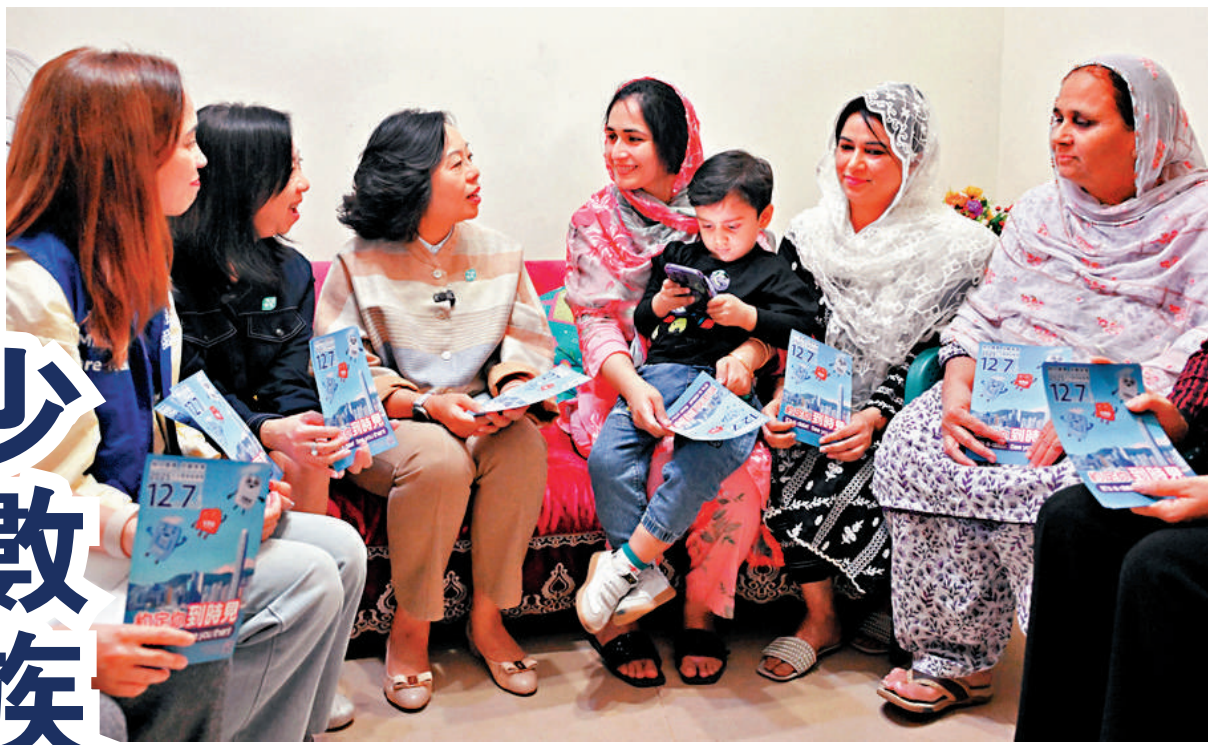
▲民政及青年事務局長麥美娟早前與民青局團隊到少數族裔社群家訪，宣傳12月7日舉行的2025年立法會換屆選舉，呼籲合資格的選民踴躍投票。