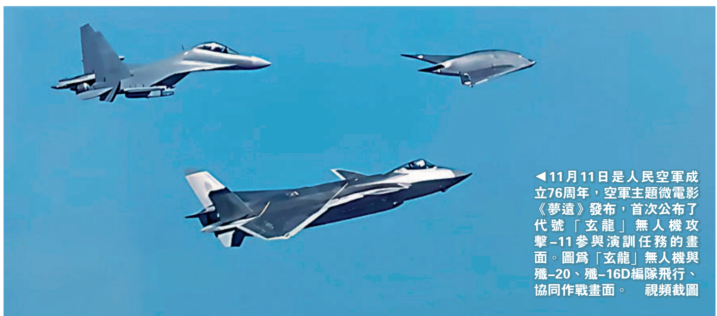
◀11月11日是人民空軍成立76周年，空軍主題微電影《夢遠》發布，首次公布了代號「玄龍」無人機攻擊-11參與演訓任務的畫面。圖為「玄龍」無人機與殲-20、殲-16D編隊飛行、協同作戰畫面。視頻截圖

此次在空軍主題微電影中亮相的攻擊-11，被稱為「玄龍08」，這一編號亦意味著攻擊-11已經批量列裝服役，形成一定的規模優勢，能夠集群出擊。「有人機／無人機」雙隱身協同，將深刻改寫空戰規則。