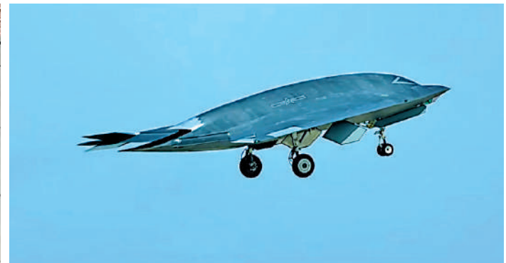
▲「玄龍」無人機正式名稱為「攻擊-11」。視頻截圖