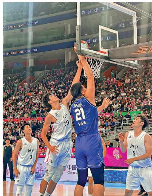
▲廣東隊球員（藍衫）上籃得分。

值得一提的是，在此前結束的十五運會群眾項目中，廣東獲得群眾比賽5人籃球男子B組、C組冠軍，5人籃球女子A組冠軍。截至目前，廣東籃球在十五運會賽場已有4金入賬，顯示在群眾籃球和競賽籃球方面，都有着扎實的基礎。