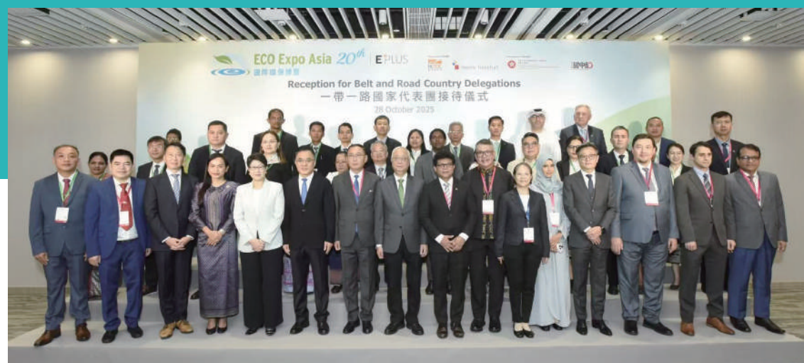
謝展寰接待一帶一路國家代表團。

第二十屆國際環保博覽日前落幕，為期4日的博覽會以「綠色科技 引領零碳未來」為主題，吸引了來自中國內地、東盟及共建「一帶一路」國家的約44個代表團、超過200名官員，以及環保領域的業界精英和專家學者參與。環境及生態局局長謝展寰接受本報專訪時表示，本屆博覽的主題不僅準確契合了《施政報告》的政策導向，更為香港與全球各地分享綠色轉型經驗、探索商機搭建了平台，助力各方通過創新科技共同邁向低碳未來。