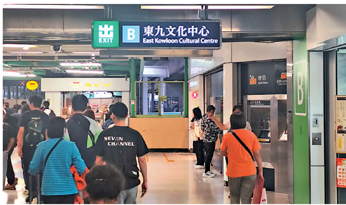
港鐵九龍灣站B出口的指示牌，近日從原來的「淘大花園」改為「東九文化中心」。

港鐵日前更換何文田站A出口的指示牌，由原本標示「愛民邨/何文田邨」，改為車站上蓋物業「朗賢峯」，引起部分居民不滿，其後港鐵將指示牌改為「何文田邨/愛民邨/朗賢峯」。改牌風波持續，九龍灣站B出口的指示牌，近日亦從附近私人樓宇「淘大花園」，改為上周一啟用的「東九文化中心」，引起市民熱議。