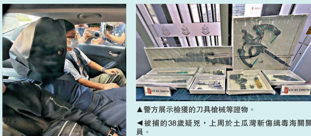
警方展示檢獲的刀具槍械等證物。