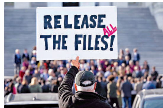
▲一名示威者12日在美國國會山附近要求當局公布愛潑斯坦案全部文件。

白宮新聞秘書萊維特指責民主黨人「有選擇性地公布文件」以抹黑特朗普。她強調，這些電郵「無法證明特朗普有任何問題」。與此同時，一項要求司法部公開愛潑斯坦案所有調查材料的兩黨聯合提案已獲得足夠支持，預計眾議院將在數周內進行表決。