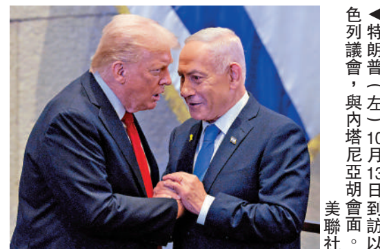
▲特朗普與內塔尼亞胡13日到訪以色列。

員曾討論在加沙將巴勒斯坦人當作「人肉盾牌」的計劃，且美國去年底就掌握了相關情報。