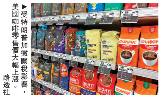
▲受特朗普加徵關稅影響

【大公報訊】據CNN報道：美國財政部長貝森特12日稱，美國將對多項「無法在美國種植」的作物降低關稅，包括咖啡、香蕉和其他水果。