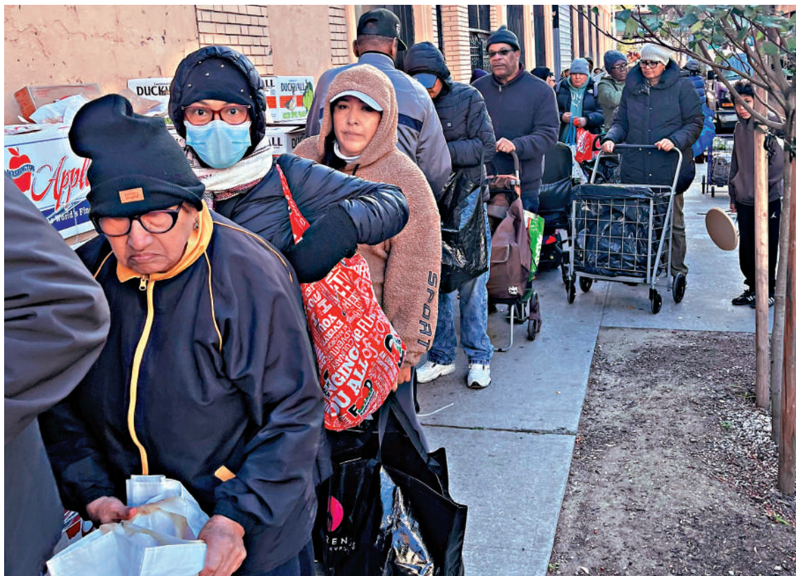
▲美國政府停擺嚴重影響民生。圖為紐約市民1日排隊領救濟食品。