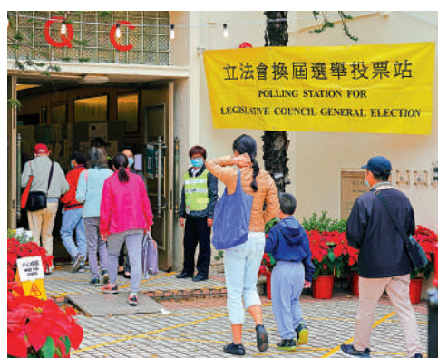
▲特區政府昨日宣布多項立法會選舉新投票安排，便利公務員及市民投票。圖為上屆立法會選舉，市民往票站投票。