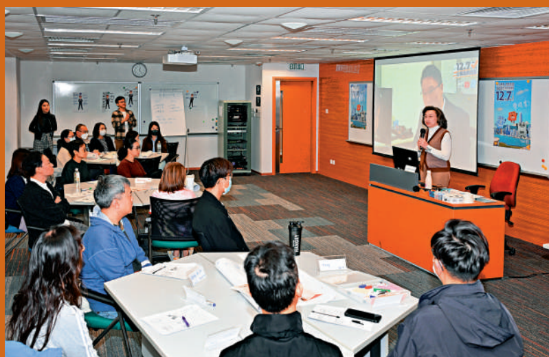
▲公務員事務局局長楊何蓓茵昨日到公務員學院，向培訓中的公務員宣傳2025年立法會換屆選舉，並呼籲積極投票。

共10個公務員專屬投票站，便利紀律部隊以及其他在鄰近地點值班的公務員投票，方便他們在完成投票程序後盡快返回工作崗位。