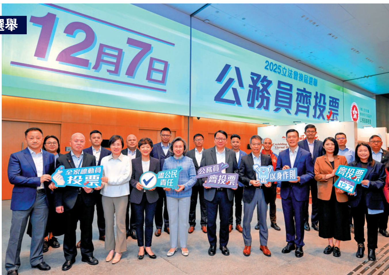
▲特區政務司司長陳國基及公務員事務局局長楊何蓓茵日前與公務員團體代表會面，籌劃推動公務員踴躍支持立法會選舉投票的工作。