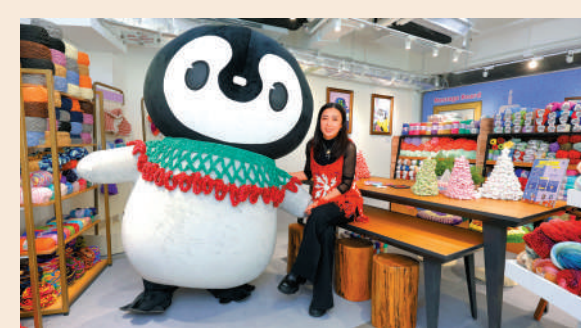
▲甘比創辦的本地鈎織手作品牌「Happy Yarn」，迎來兩歲生日的大日子。

一直積極推廣鈎織文化。據介紹，首屆新冷發布交流會反應熱烈，Happy Yarn品牌特別三度加開，介紹來自世界各地不同款式的冷材。