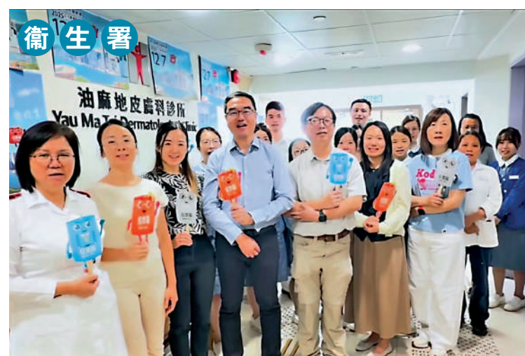
▲衛生署皮膚科主任顧問醫生葉方正拍片呼籲同事在立法會選舉踴躍投票。