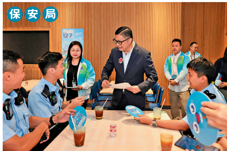
▲鄧炳強近日走訪飛行服務隊分部、醫療輔助隊總部、分區警署同消防局，分享立法會選舉投票的重要意義。

葉方正指出，公共醫療基建如新建醫院及診所必須經過立法會撥款才可落實推展，社會衛生服務現正在將軍澳及石硤尾籌建的新皮膚科診所，正是獲立法會財委會通過撥款才得以正式上馬展開工程。每名立法會議員如何行使權力、提出意見、與政府互相配合或制衡，均影響醫療政策的落實，直接關係醫療衛生服務的成效和廣大市民的福祉。