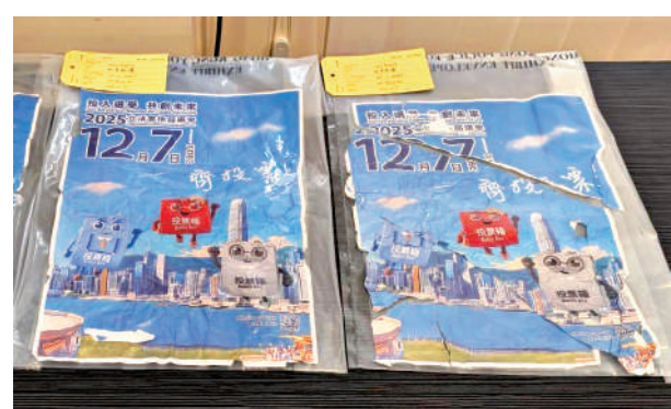
▲旺角塘尾道天橋立法會選舉海報遭人為破壞，兩男被捕。

警方提醒，根據香港法例第200章《刑事罪行條例》，任何人在無合法辯解的情況下，毀壞或損壞他人財產，即屬違法，一經定罪最高可判處10年監禁。警方重申，對於任何企圖干擾、破壞或擾亂立法會選舉的行為，將秉持零容忍、絕不姑息的態度，全力展開調查並依法處理。