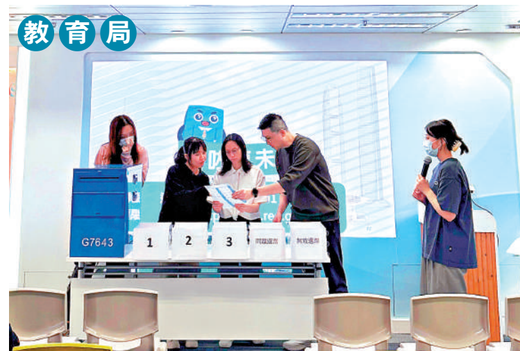
▲教育局於學習圈活動中宣傳並鼓勵教育界同工於選舉當日投票。