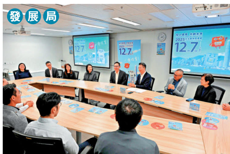
▲發展局副局長林智文日前到訪多個轄下部門，呼籲同事踴躍投票。