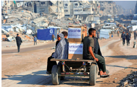
▲巴勒斯坦民眾18日在加沙城運送救濟物資。

傅聰在會上呼籲以色列保障大規模人道物資進入加沙。他表示，人道救援不能被政治化，飢餓不能被武器化，人道工作者不能成為襲擊目標，遵守