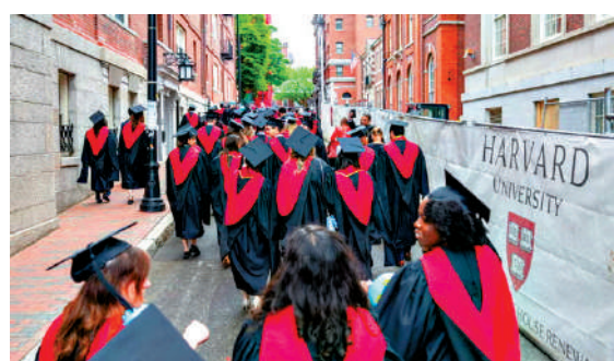
▲最新報告稱，今年秋季學期美國大學的國際學生新生人數下降17%。圖為今年哈佛大學應屆畢業生。

國際學生交納的學費是美國高等教育產業的重要收入來源，新入學國際生人數下降為高校帶來財政壓力。許多受訪院校反映，印度學生入學人數有所減少。印度是美國高校國際學生最大來源國之一。