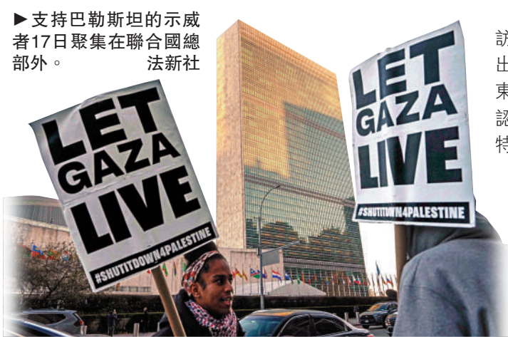
▶支持巴勒斯坦的示威者17日聚集在聯合國總部外。

此外，沙特王儲穆罕默德18日時隔七年訪問美國，特朗普17日透露，美國將向沙特出售F-35戰機。沙特將成為以色列以外，中東地區第二個擁有F-35戰機的國家。有分析認為，軍售或改變中東軍事平衡。美媒形容，特朗普力推沙特和以色列關係正常化，F-35可能會成為談判條件，但軍售仍需經過重重審批，包括得到美國國會批准。以色列國防軍日前向以色列政府領導層提交了一份正式的立場文件，強烈反對美國可能向沙特出售F-35戰機，並警告稱此舉或削弱以色列在中東的空中優勢。（綜合報道）