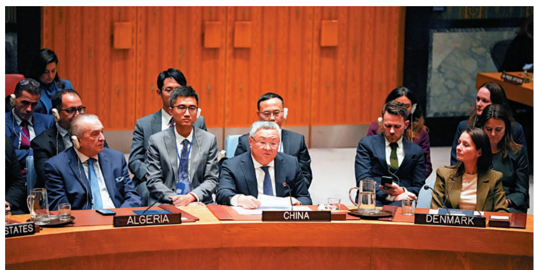
▲11月17日，中國常駐聯合國代表傅聰（前排中）在安理會會議上發言。