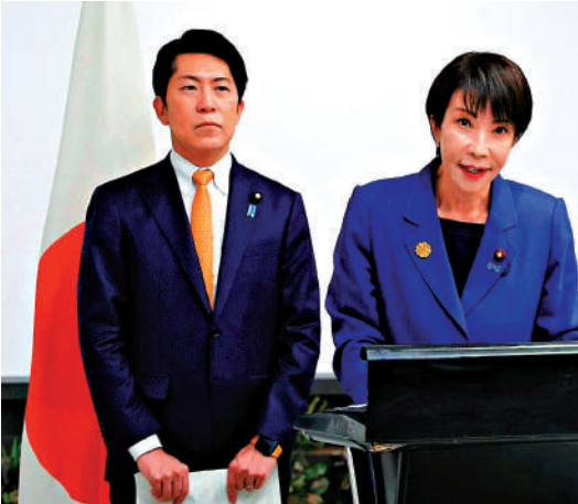
▲高市早苗（右）任用佐藤啟的決定再次受到日本民眾質疑。

高市上月不顧在野黨陣營強烈反對，任命涉「黑金」醜聞的佐藤啟為內閣官房副長官，當時就引發廣泛爭議。《文春周刊》近日曝光關於佐藤啟的新醜聞，指出他曾於2022財年收受愛知縣一家醫療團體10萬日圓政治獻金，而這家醫療團體被控在2020年至2023年利用非法手段領取約4.5億日圓的政府醫療補貼。新