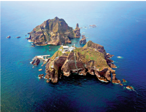
▲日本官員18日稱「竹島」（韓國稱「獨島」）是日本領土，引起韓方抗議。資料圖片

【大公報訊】綜合報道：日本政府近日在歷史、領土等問題上的言行引起周邊國家不滿。日本領土問題擔當大臣赤間二郎18日稱，日韓爭議島嶼「竹島」（韓國稱「獨島」）「在國際法上是日本固有領土」。韓國外交部隨即召見日本駐韓國大使館總括公使松尾裕敏，提