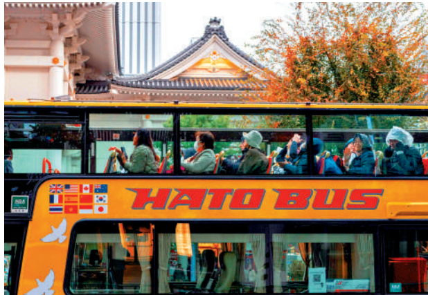
▲日本旅遊相關行業擔心因中國遊客減少而蒙受損失。

近日，國航、東航、南航等多家航空公司相繼發布了針對日本航線的特殊退改方案，符合條件的客票可在航班起飛前，免手續費辦理變更或全額退票。一名航空分析師透露，僅在15日至17日便有約50萬張赴日機票被退訂。這名分析師表示，這對中國航空公司的影響有限，因為中日航線市場規模與整個國內國際市場相比仍較小。但對本就陷入困境的日本經濟而言，中國遊客銳減無疑是雪上加霜。日本國家旅遊局數據顯示，今年中國內地遊客佔赴日國際遊客總人數的23%左右。日本野村綜合研究所研究員木內登英預測，日本今後一年的旅