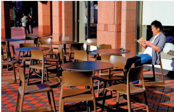
▲17日，日本東京一家咖啡店生意冷清。

日本山口大學名譽教授縯厚表示，高市明顯存在一種政治盤算，即通過持續強調「中國威脅論」和「警惕中國論」來鞏固自己的支持基礎，但「對於日本的安全保障、外交以及經濟而言，與中國建立互惠關係才應是最優先事項」。縯厚強調，日本應該根據中日邦交正常化時確認的一個中國原則，致力於構建對華和平關係。一些日本網友也對高市破壞中日關係的言行表示不滿，並敦促其引咎辭職。一名網友指出，日本與中國交惡有百害而無一利。（綜合報道）