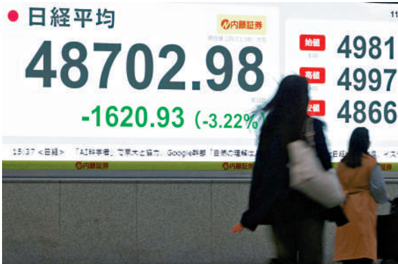
▲東京股市兩大股指18日連續第3個交易日下跌。

日本首相高市早苗近日悍然發表涉台挑釁言論。日本媒體和專家擔憂中日關係惡化，將衝擊本已面臨下行壓力的日本經濟，導致第四季度經濟再現負增長。受投資者對中日關係惡化的擔憂上升等因素影響，東京股市兩大股指18日連續第3個交易日下跌。有分析指出，如果高市政府不撤回相關言論、阻止事態進一步惡化，日本實體經濟恐受到更嚴重傷害。日媒稱：「高市作為首相的存在本身才是日本的存亡危機。」