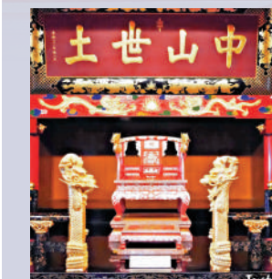
▲首里城位於沖繩那霸市，是琉球國的政治、外交與文化中心，於2000年被聯合國列為世界文化遺產。 ▲清康熙帝賜琉球王手書「中山世土」，被製成匾額懸掛於琉球王宮殿正殿王座之上。