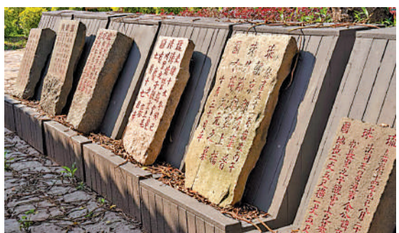
▲福州白泉庵的琉球墓園內，長眠着明清時期跨海來閩的琉球人。

明朝閩人三十六姓移居琉球，「他們大多是福州河口一帶善於駕船的百姓，為琉球帶去了先