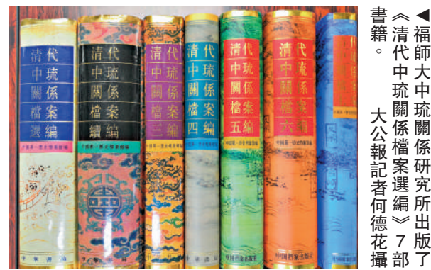
▲福師大中琉關係研究所出版書籍。