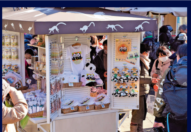
▲遊客在日本東京上野動物園參觀大熊貓後選購大熊貓紀念品。