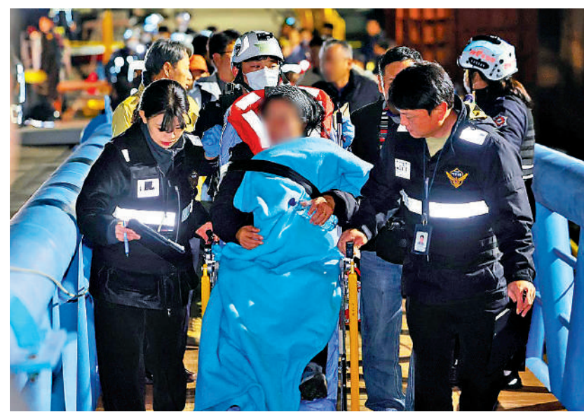
▲觸礁客輪上的乘客19日晚獲救，被轉移至專用碼頭。

廣島縣知事湯崎英彥表示，目前的情況已達「災害等級」，並呼籲日本中央政府高度重視。鈴木憲和稱，將查明原因，並與地方當局協調，為牡蠣養殖戶提供支持。