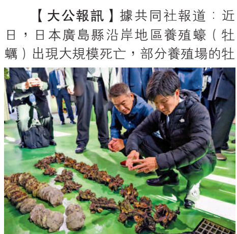
▲日本農林水產大臣鈴木憲和19日查看死去的牡蠣。

【大公報訊】據共同社報道：近日，日本廣島縣沿岸地區養殖蠔（牡蠣）出現大規模死亡，部分養殖場的牡蠣死亡率甚至高達九成。日本業界擔憂產量大跌不僅將影響日本國內供應，還將影響出口。有分析認為，海水溫度異常偏高等環境因素是導致牡蠣死亡的主要原因。