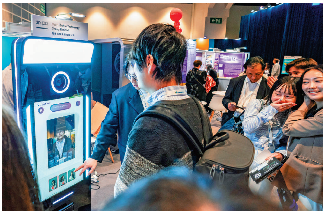
▲香港中小企一直面對資源缺乏的問題。隨着AI應用的普及，中小企可以更有效地運用資源，從而提升競爭力。