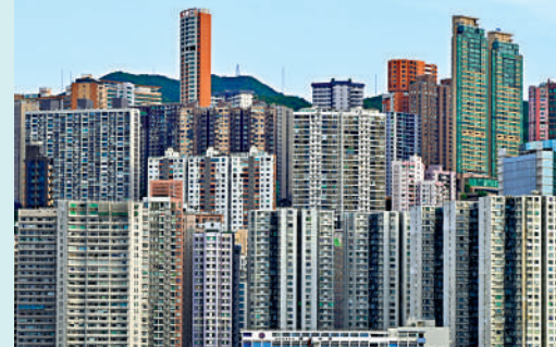
▲不少人認為置業是累積財富的最佳和最簡單途徑。