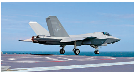
▲在近日福建艦的首次海上實兵訓練任務中，殲-35艦載機彈射起飛。

彈艙設計，能夠納入6枚採用摺疊彈翼的霹靂-15中遠程空空導彈，從而增強了其超視距作戰能力，可在空戰中能更長時間保持火力優勢，為奪