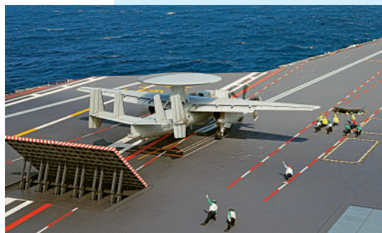
▲福建艦上的空警-600預警機。