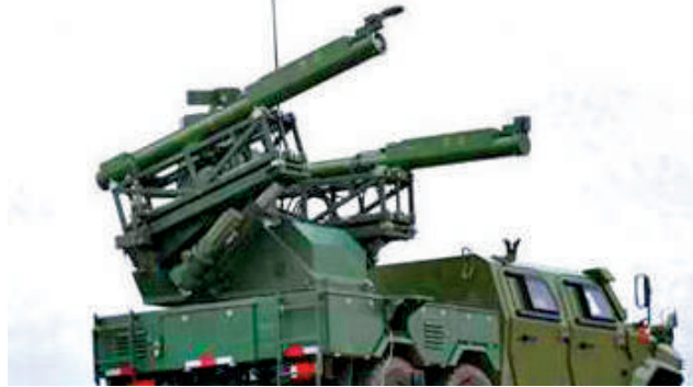
◀在日前訓練中，紅旗-13防空導彈首次亮相。