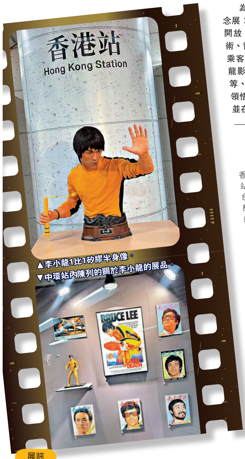
▲李小龍1比1磅膠半身像。 ▼中環站內陳列的關於李小龍的展品。