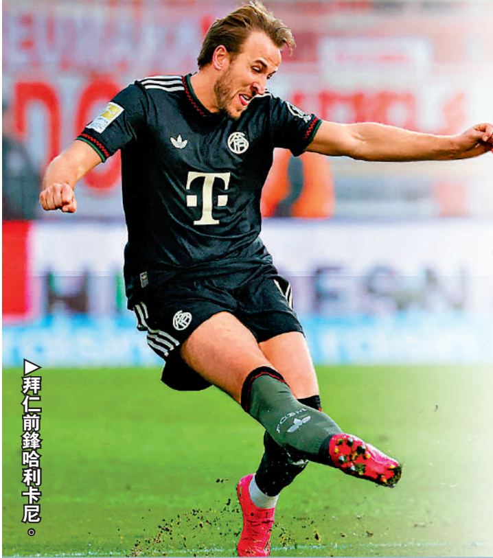
▶拜仁前鋒哈利卡尼。

【大公報訊】記者譚德龍報道：拜仁慕尼黑射手哈利卡尼今季狀態巔峰，所有賽事18仗已入24球，27日凌晨歐聯第5輪作客同屬4戰全勝的阿仙奴，過往21戰攻入對方15球的卡尼，除了要令阿仙奴在今屆歐聯首次失球外，適逢其母會熱刺剛於英超作客慘敗於對方1：4，故今次回來北倫敦酋長球場，更要肩負起為母會復仇之重任。 卡尼目前在各項賽事都有「士哥」，當中歐聯4戰入5球，助拜仁暫時與阿仙奴及國際米蘭成為僅3支全勝的隊伍；前屆歐聯8強首回合，卡尼也在酋長球場射入1球。也許基於穆西亞拿養傷關係，卡尼今季更作新嘗試，隨後擔任創造性中場或第二前鋒的角色，在中鋒尼高拉斯積極護護下亦不減入球能力，同時也出力協助防守，表現更加全面。 除卡尼外，拜仁翼鋒米高奧利斯亦回到倫敦，與昔日水晶宮隊友、剛對熱刺時連中三元的阿仙奴中場伊比爾治伊斯交手，而在左翼路爾斯戴亞斯上一輪領紅而停賽下，奧利斯在右路發難就更見重要。 阿仙奴是4輪唯一不失球隊，英超暫時亦僅失6球，防守堪稱銅牆鐵壁，儘管中堅加比爾馬加希斯仍未復出，但仍有由德甲利華古遜借用的軒卡派爾可派用場，此役勢均力敵各取1分對雙方都屬理想結果，就博「主客和」的和。（NOW643台27日凌晨4時直播）