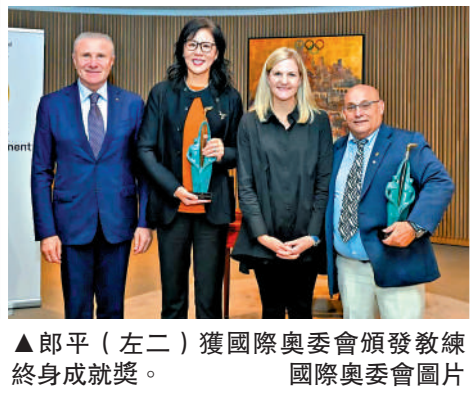
▲郎平（左二）獲國際奧委會頒發教練終身成就獎。

【大公報訊】據中新社報道：當地時間24日，國際奧委會在總部瑞士洛桑頒發國際奧委會教練員終身成就獎，來自中國的排球教練郎平和來自古巴的摔跤教練迪亞茲獲獎。 國際奧委會教練員終身成就獎於2017年設立，旨在表彰教練員在運動員職業發展與個人成長中發揮的重要作用，每年評選兩名在國際體壇做出卓越貢獻的教練，郎平是獎項評選至今第一個獲獎的三大球項目教練。據介紹，今年的提名人數達到了創紀錄的152人。 國際奧委會主席考文垂表示，郎平與迪亞茲