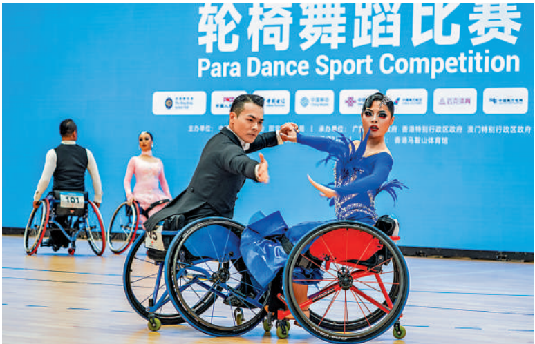
▲殘特奧會大眾項目輪椅舞蹈比賽9月在港進行兩天的比賽。 資料圖片 ◀馬鞍山體育館曾在9月舉辦殘特奧會大眾項目輪椅舞蹈比賽。 資料圖片