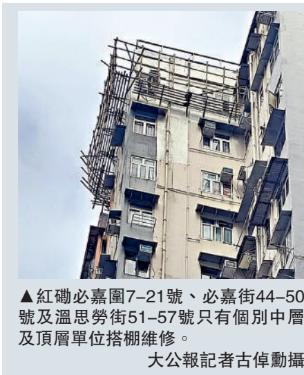
▲紅磡必嘉圖7-21號、必嘉街44-50號及溫思勞街51-57號只有個別中層及頂層單位搭棚維修。