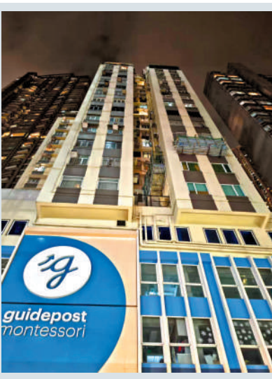
建築停止工程的通知。