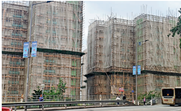
現時深水埗怡閣苑及清麗苑都在進行大型外牆維修工程。

另外，屋宇署截至昨日已就352幢有棚網的私樓抽取樣本，陸續分批送交測試，建築署已巡查轄下所有18個工務工程樓宇項目並取樣檢驗。至於勞工處的全港性特別執法行動，截至昨午4時，已巡查110個建築地盤，共發出70份書面警告及46張敦促改善通知書，並提出11宗檢控。