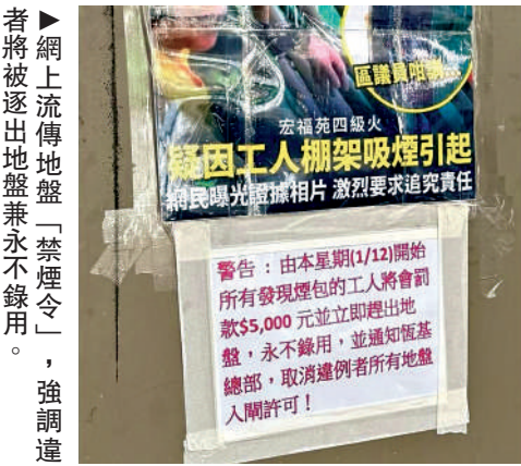
▶網上流傳地盤「禁煙令」，強調違者將被逐出地盤兼永不錄用。

基總部取消所有地盤入閘許可，無法進入同系地盤。 網民普遍認同「禁煙令」，強調嚴格禁煙是防止地盤火警的重要一步，又希望「可以永久執行，所有地盤加入。」有在地盤工作的網民分享，身處的地盤已「正式全面改革」，「今早返到地盤門口開始查袋，可見呢件事嘅嚴重性令地盤大改革。」