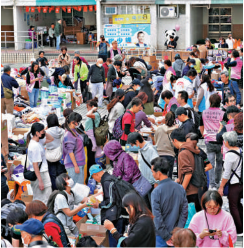
▲發言人強調，特區政府絕不容忍對特區政府及救援人員工作的惡意抹黑。

發言人表示，社會大眾必須對利用災情散播失實資訊，意圖分化社會、煽動市民對特區政府和對國家仇恨等危害國家安全的行為提高警覺。特區政府呼籲社會大眾不要以身試法，不應與破壞社會穩定的反中亂港分子有任何瓜葛，堅決與其劃清界線。針對任何惡意抹黑、煽動仇恨的行為，特區政府將全力做到「違法必究，雖遠必誅」，依法採取果斷執法行動。