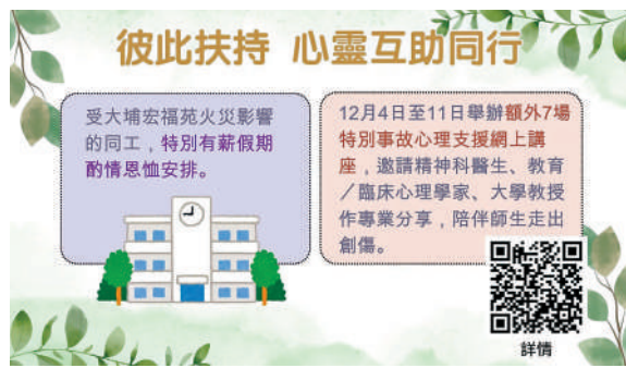
▲教育局着力支援教育同工，如舉辦特別事故心理支援講座。