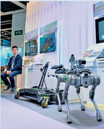
▲港投已投資項目，涵蓋硬科技、生命科技及新能源與綠色科技等。