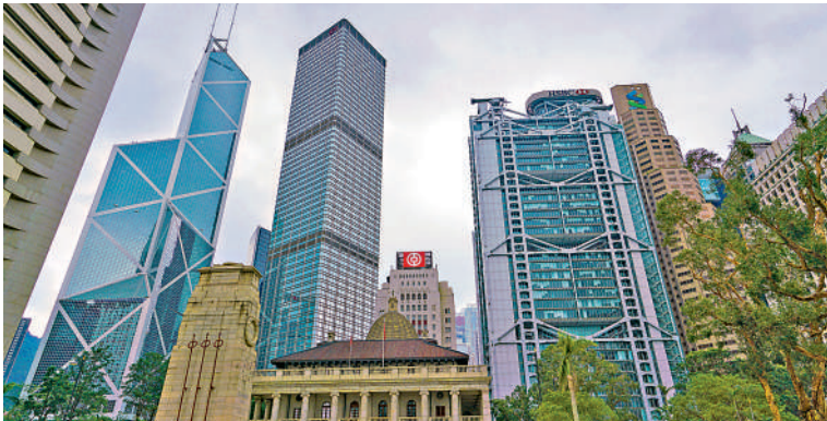
▲銀行界宣布推出五項新措施支援大埔宏福苑火災受災人士，涵蓋財務紓困、手續簡化、服務延長及詐騙防範。

第五，繼續延長大埔區銀行分行的服務時間。金管局與銀行公會表示，注意到有騙徒利用大埔火災行騙，市民若接到自稱銀行職員的來電時，