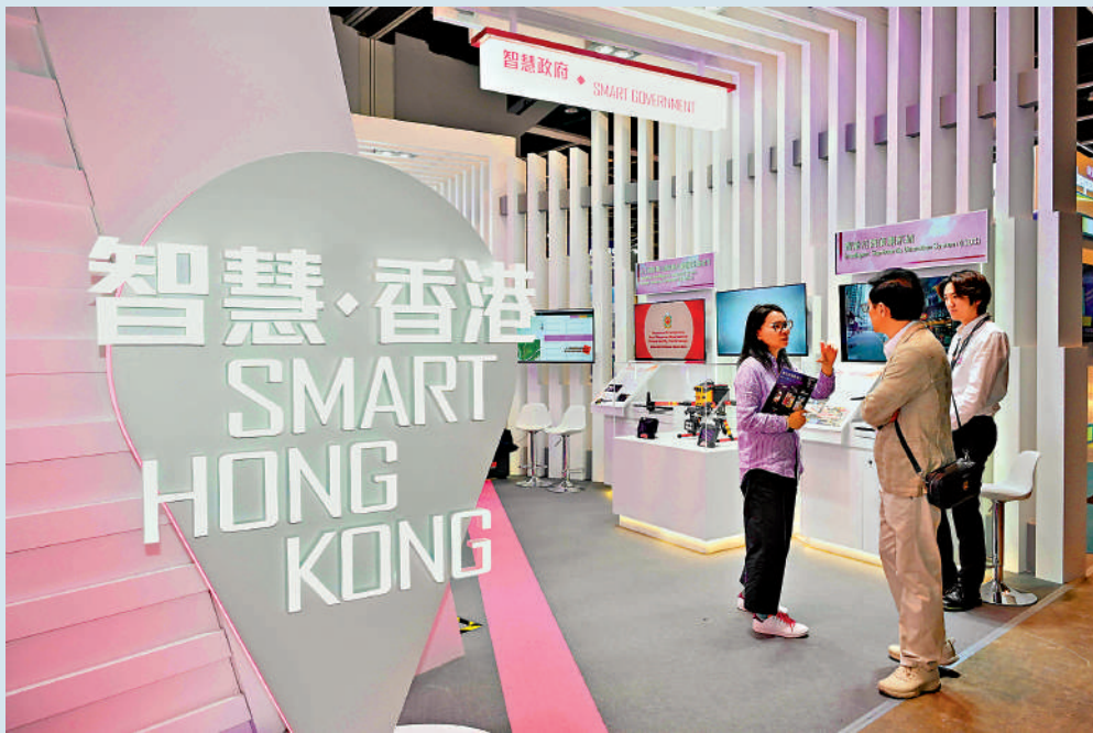
▲港投的投資已產生了顯著的「以資匯資」槓桿效應。