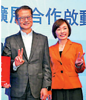
▲港投主席陳茂波（左）與行政總裁陳家齊。

財政司司長兼港投主席陳茂波在年報中指出，港投公司是特區政府的耐心資本投資平台，肩負着提升本港經濟活力及長遠競爭力，並爭取財務回報的雙重使命。他表示，港投公司通過不同渠道及投資由本地大學培育或與本地大學相關的項目，助力將前沿研究成果轉化為實質落地的解決方案，