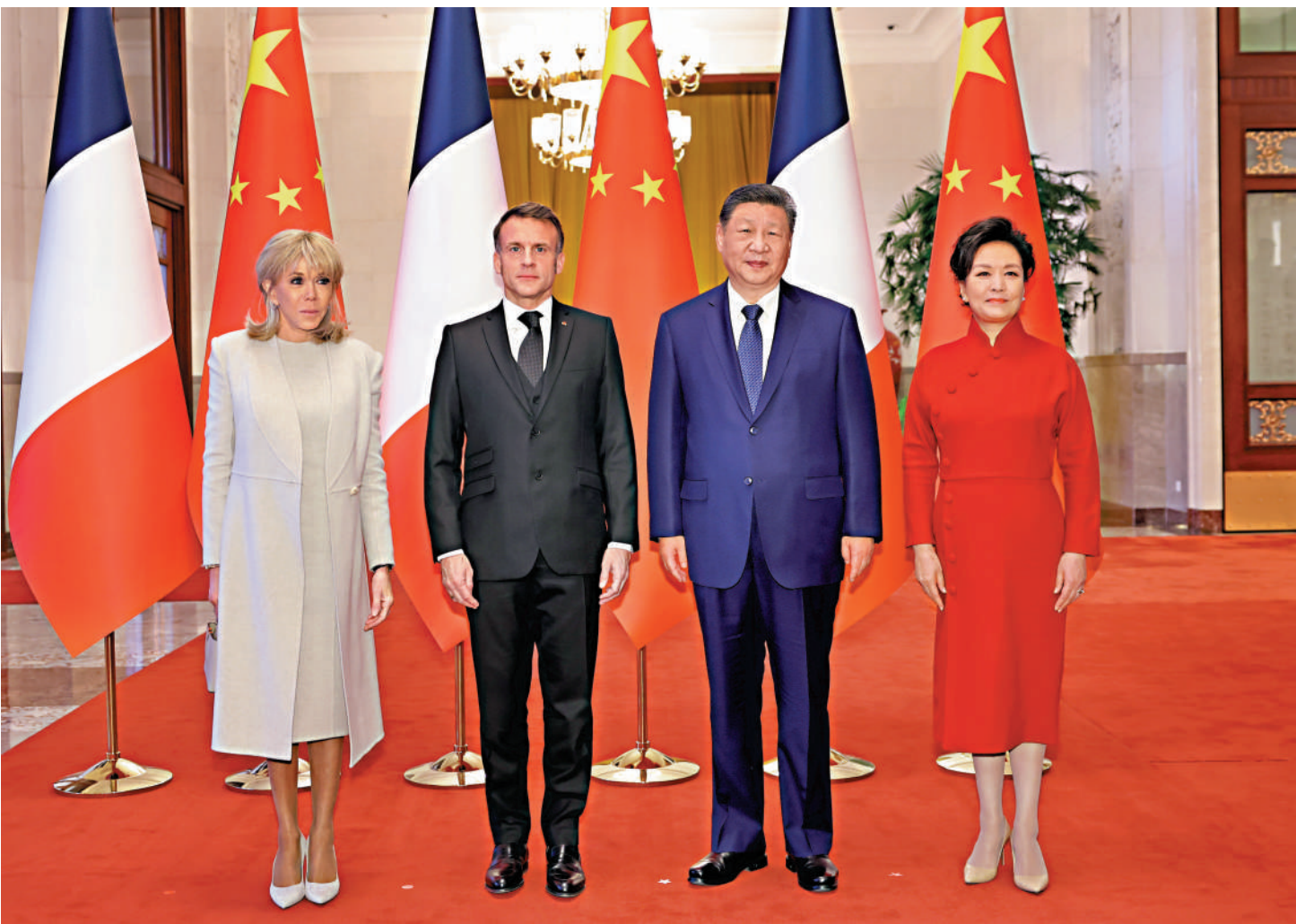
▲12月4日上午，國家主席習近平在北京人民大會堂同來華進行國事訪問的法國總統馬克龍舉行會談。這是會談前，習近平和夫人彭麗媛同馬克龍總統夫婦合影。

習近平強調，中方願同法方一道，始終從兩國人民根本利益和國際社會長遠利益出發，堅持平等對話、開放合作，讓中法全面戰略夥伴關係在「新甲子」走得更穩更好。中法同為聯合國創始成員國和安理會常任理事國，應當踐行真正的多邊主義，維護以聯合國為核心的國際體系和以國際法為基礎的國際秩序，就政治解決爭端、促進世界和平穩定加強溝通和協作，推動改革完善全球治理。