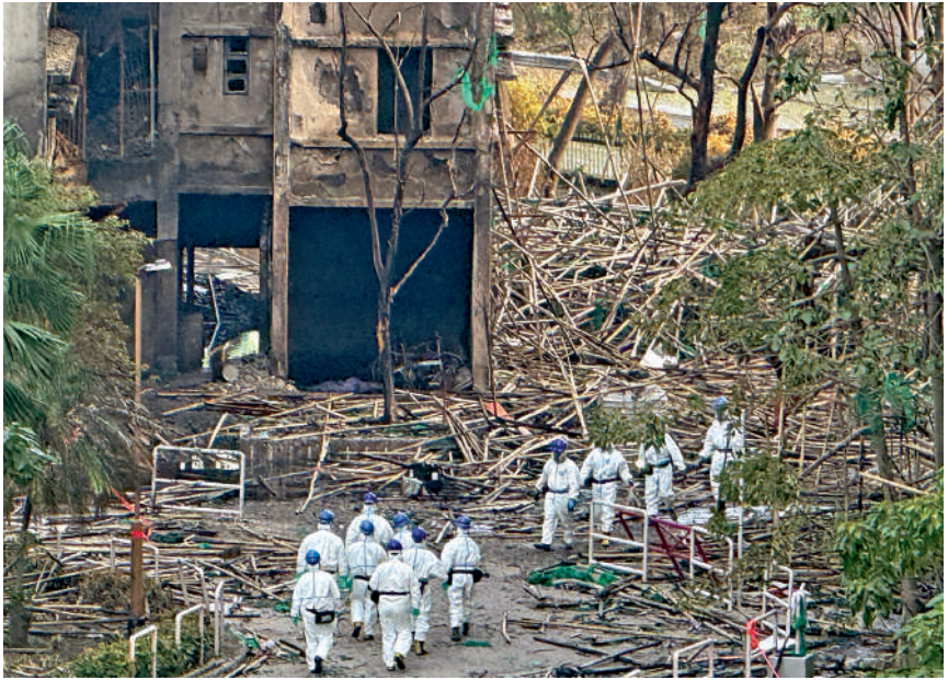
▲警方災難遇害者辨認組人員昨日在大埔宏福苑大廈外圍展開搜索工作，在災場檢取多袋焦黑物件。

警方災難遇害者辨認組、鑒證科及消防處人員，昨日早上繼續對災場外圍展開搜索工作。政府化驗所人員在為地面棚架作測量工作，地政測繪處人員使用可穿戴式行動製圖系統，通過結合雷射掃描、攝影，測量災場複雜的室內外環境。至下午2時許，有工人使用機械拖走部分倒塌的竹棚，以便人員進行搜證。其間，不時有DVIU人員提着透明膠袋裝着的多袋焦黑物體離開災場。