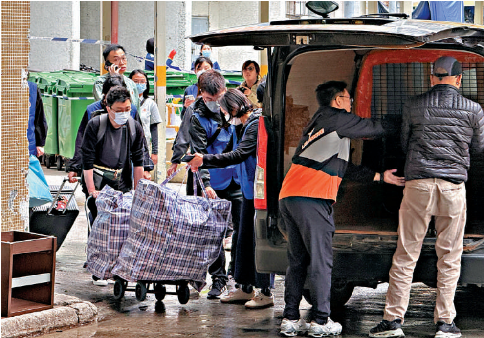
▲宏志閣昨日繼續有居民返回住所取回物品，現場有應急隊成員及義工協助，居民對安排滿意。