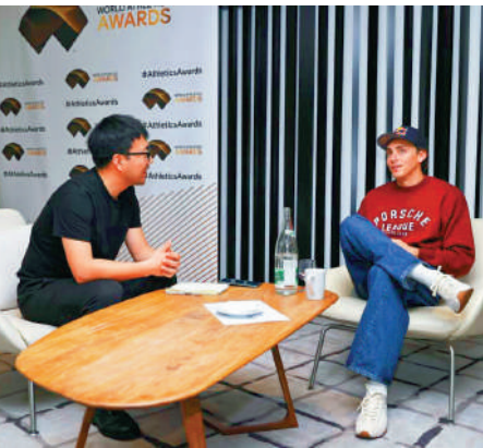
▲杜普蘭蒂斯（右）在蒙特卡洛接受新華社記者專訪。

【大公報訊】據新華社報道：2027年北京將舉辦田徑世錦賽，當被問及能否為北京保留一厘米，已經14次刷新世界紀錄的杜普蘭蒂斯說：「當然可以！雖然很難完全保證，但我可以這麼說：我得到的支持越多，破紀錄的機會就越大。現場觀眾越熱情，我就越有力量，越能被激發出更高的狀態。」2025年度世界田聯頒獎典禮11月30日在摩納哥舉行，瑞典撐竿跳高名將杜普蘭蒂斯當選年度世界最佳男運動員。當天，他接受了新華社記者專訪。