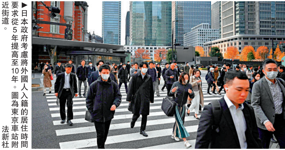
日本擬收緊外國人入籍條件，要求從5年提高至10年。圖為東京車站附近街道。

【大公報訊】綜合共同社、《日本時報》報道：日媒援引知情人士透露，日本政府考慮將外國人取得日本國籍的居住時間要求，從5年提高至10年。相關調整將納入明年1月公布的外國人政策基本方針。 現行規定中，外國人獲得日本永住許可（永居）須在日居住10年以上，但入籍的居住時間要求為5年以上。有意見認為，日本入籍的居住時間比永居時間要短，這與其他國家的情況正好相反。自民黨4日討論相關規定，政府提出收緊條件的規劃。據報道，日本政府