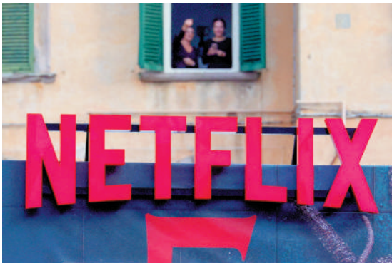
▲Netflix宣布以720億美元收購華納兄弟探索。

不過，業界憂慮此次收購案會導致主流院線片源大幅減少。另外，該交易必須接受美國與歐洲的反壟斷審查。美國共和黨籍眾議員伊薩已致函監管機構，認為併購可能損害市場競爭。