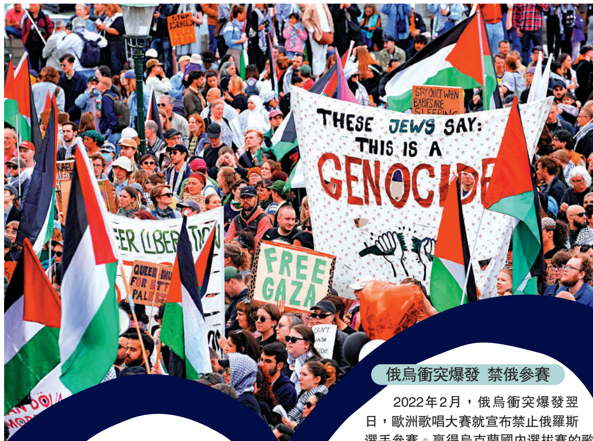
▲去年5月歐洲歌唱大賽期間，示威者聚集抗議以色列選手伊登·戈蘭參賽。