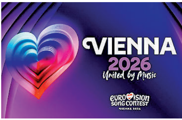
▲2026年歐洲歌唱大賽將在奧地利維也納舉行。

歐洲歌唱大賽的主辦方歐洲廣播聯盟（EBU）4日宣布，允許以色列繼續參加2026年比賽，此舉引起愛爾蘭、西班牙、荷蘭和斯洛文尼亞等四國不滿，宣布退賽。四國認為，以色列在加沙衝突造成人道災難，呼籲將以色列排除在賽事之外。作為歐洲歷史悠久且廣受歡迎的歌唱盛事，歐洲歌唱大賽近年深陷「政治化」漩渦，爭議不斷，尤其是多次偏幫以色列引發不滿，本次事件被視為比賽舉辦70年來最大內部分歧。