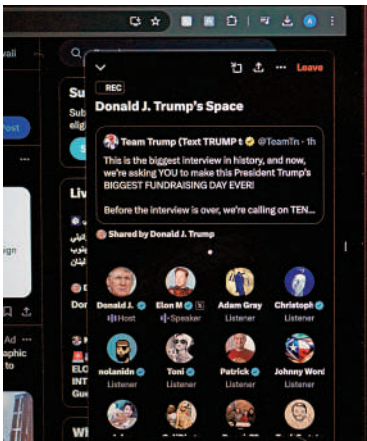
▲歐盟5日對馬斯克旗下社交平台X處以1.2億歐元罰款。路透社

歐盟科技事務專員維爾庫寧在宣布處罰時強調，「此決定關乎X平台的透明度，與審查制度