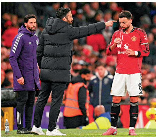
▲曼聯領隊阿莫林（左二）在比賽中指揮。