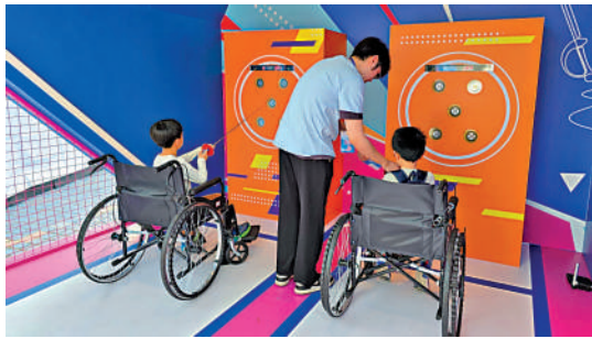
◀兒童試玩模擬比賽項目。

乒乓球比賽村與全運會期間的比賽村性質相同，有眾多攤位宣傳今屆賽事香港賽區有份舉辦的運動項目。今屆香港承辦輪椅劍擊、硬地滾球、殘奧乒乓球和特奧乒乓球4個項目，現場亦有攤位介紹和模擬比賽的遊戲，讓殘疾人運動得到很好的推廣。