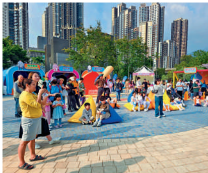
◀市民在乒乓球村觀看表演。

殘特奧會延續全運會的全城運動熱潮。昨天是特奧乒乓球展開的首天比賽日，除精彩的比賽以外，組委會特意安排在舉辦場地的荃灣體育館外設置了乒乓球比賽村，當中設置多個攤位。其間更有精彩的花式跳繩表演，吸引不少市民入村遊玩和駐足觀看。