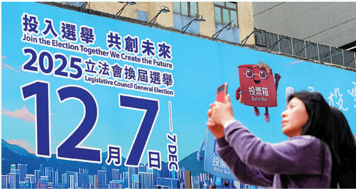
今日投票日，記得帶同身份證到票站投票。