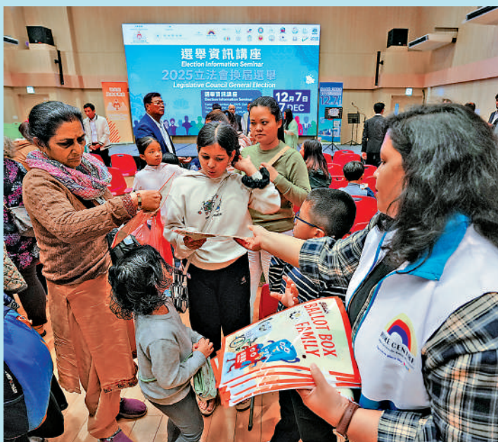
▲昨日舉行的「選舉資訊講座」吸引近百位少數族裔居民參加。