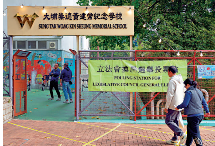
▲受宏福苑火災影響，大埔區其中一個投票站改為設置於大埔崇德黃建常紀念學校。