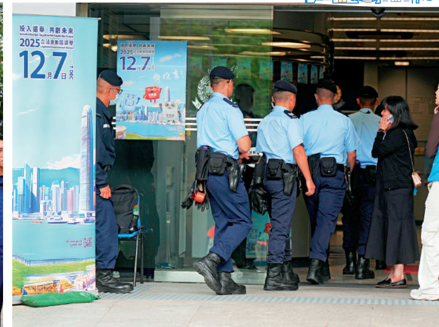
▲全港設有十個公務員專屬投票站，便利紀律部隊及其他值班的公務員投票，在完成投票程序後能盡快返回崗位。