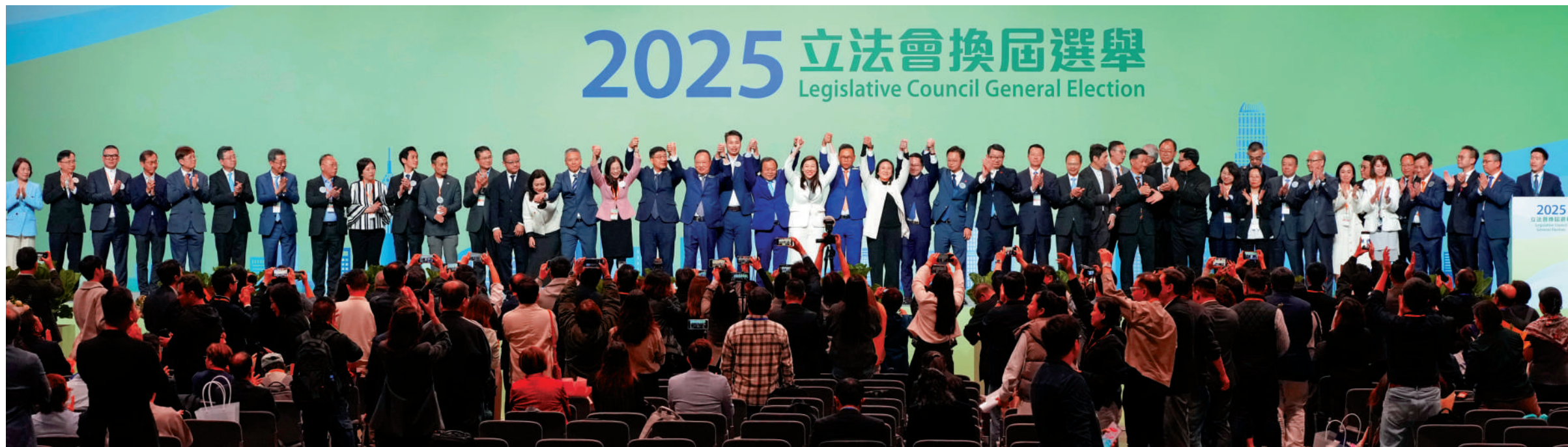
▲選管會在今天凌晨約一時公布立法會選委會界別當選人名單。