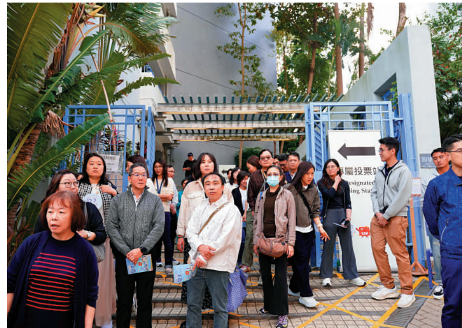
▲大批醫護人員昨日前往專屬票站投票，並點讚設於醫院附近的票站十分方便，形容「行幾步路就可以來投票」。