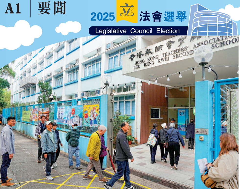
▲宏福苑火災後，大埔區內三個投票站作出調整，不少暫時搬到其他地區暫住的居民昨日仍然堅持回來投票。