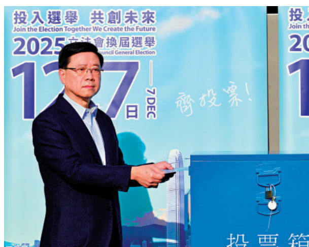
▲行政長官李家超昨日上午到高主教書院投票站投票。

李家超表示，大埔宏福苑火災令大家都很悲痛，政府正全力善後、調查真相，並推動系統性改革，防止悲劇重演。在災後重建的關