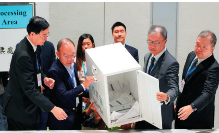
▲政制及內地事務局局長曾國衛與選管會主席陸啟康，凌晨在中央點票站主持「開箱」儀式。

在所有投票站中，大埔區的票站無疑最受全港市民關注。選舉事務處重新安排3個投票站，並安排免費接駁交通，接載選民前往