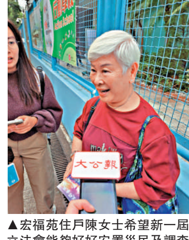
▲宏福苑住戶陳女士希望新一屆立法會能夠好好安置災民及調查火災真相，避免悲劇再發生。