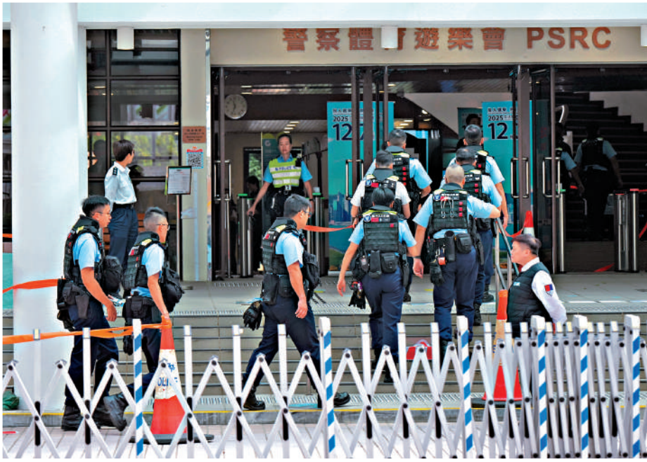
▲警察體育遊樂會專屬票站，警務人員前往投票。