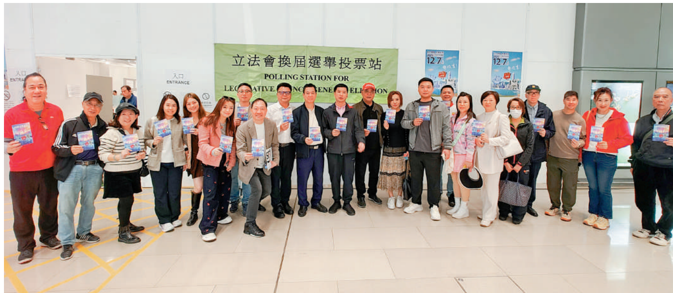
▲珠海港人組團前往港珠澳大橋香港口岸的鄰近邊境投票站完成投票。