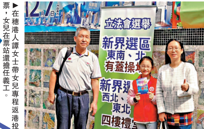
▶在穗港人譚女士帶女兒專程返港投票，女兒在票站還擔任義工。