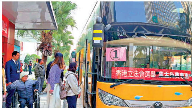
▲7日上午，三輛載着返港投票港人的專車從廣州祈福新村出發。