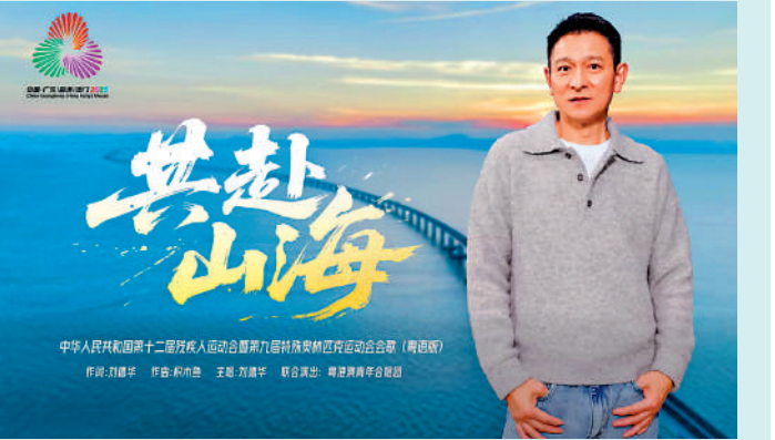
▲劉德華為《共赴山海》打造粵語歌詞。