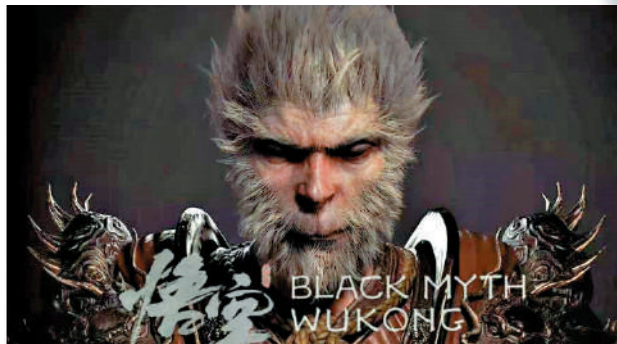
▲動作遊戲《黑神話·悟空》去年面世。

習近平總書記指出：「文化興則國運興，文化強則民族強。」現在，中國動漫遊戲產業重視創新，再加上政府支持文化產業發展，給優秀作品的誕生創造了好環境，讓中國文化在世界上的影響力愈來愈大。